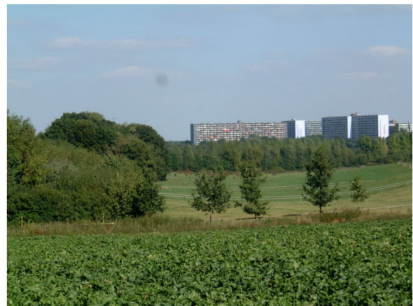
Nieuw bos aan de stadsrand; belangrijke uitloopgebieden

Circa 25% van het nieuwe bos maakt deel uit van "nieuwe landgoederen" of experimentele "Rood-voor-Groen" projecten. In beide gevallen gaat het om een koppeling van diverse vormen van woningbouw of bedrijven aan bosaanleg. Hierbij kunnen fiscale voordelen worden genoten door toepassing van de Natuurschoonwet en wordt tevens en provinciale subsidie verstrekt.