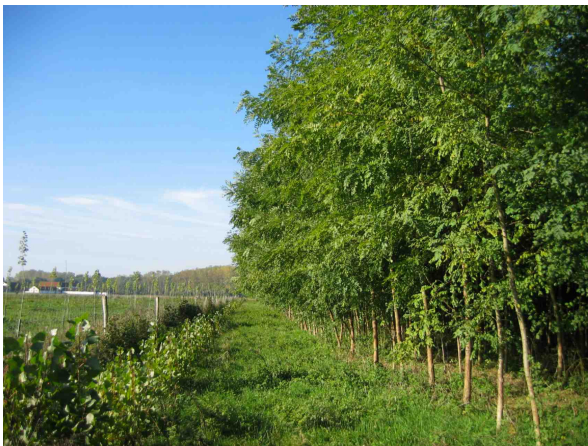
Snelgroeïend bos; links populier en rechts robinia

hiervan zijn onder andere een beheer dat vooral gericht is op het ontstaan van korte vegetaties en het voorkómen van bosvorming. Echter de ontwikkelingstijd van spontaan bos is veel langer dan de eerste periode van 5 jaar die nu voorbij is. Wellicht dat de huidige theoretische achterstand in de toekomst wordt ingelopen als er meer gronden zijn aangekocht en ingericht en als er een langere ontwikkelingstermijn is verstreken. Zoals gezegd wordt aan de categorie multifunctioneel bos op dit moment de meeste aandacht gegeven. Dit is de categorie waar het gemakkelijkste gestuurd kan worden en waar de provincie dus de meeste invloed op uit kan oefenen. Daarnaast is dit ook de categorie waar recente thema's als Mensgerichte natuur, Groen in en om de stad (GIOS) en 'Rood voor Groen' naadloos in passen. De provincie heeft afgelopen 5 jaar veel ervaring opgedaan met betrekking tot het proces om tot de aanleg van dit multifunctioneel bos te komen. In de volgende paragrafen wordt beschreven wat de faal- en succesfactoren zijn en wat dit tot nu toe heeft opgeleverd.