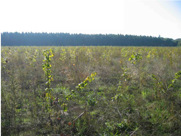
Nieuw bos als versterking van een bestaande