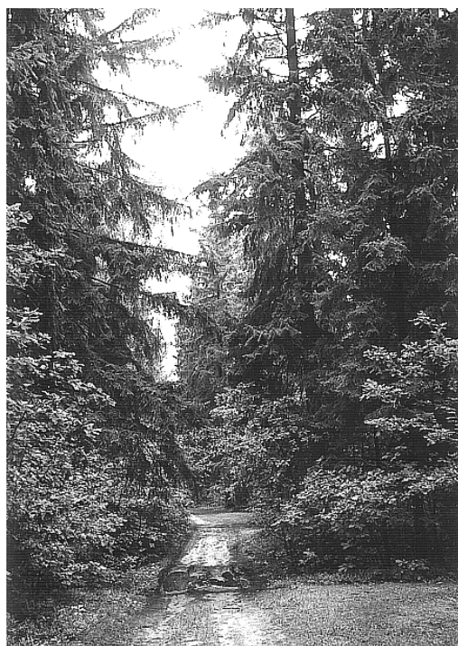
Op de drogere, hoger gelegen zandbodems van Białowieża floreren de Grove dennen-Fijnsparren bossen. De Fijnsparren kunnen liefst 55 meter hoog worden en torenen boven alle andere bomen uit.

Langs de spoorlijn zijn vrij vaak Edelherten actief. De spoorlijn is namelijk vrij open en er is voor de dieren behoorlijk wat voedsel te vinden. Ook staat hier Turkse lelie in de berm, die slechts een van de vele planten is die hier voorkomen. Zo staat hier ook de kruising van Brede en Roodbruine wespenorchis in vrij grote aantallen. Het talud wordt ook gebruikt door reptielen zoals de Hazelworm.