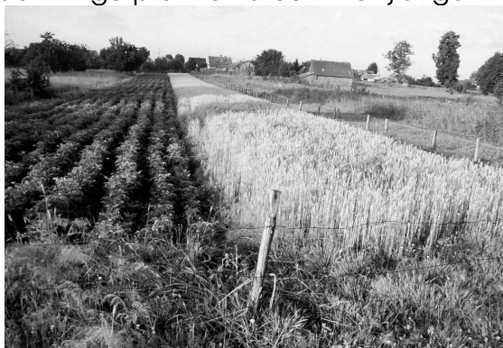
Kleinschalige landbouw op de vlakte van Białowieża

Ten zuiden van Grudki is er nog een blauw gemarkeerde route die naar het oosten toe naar het boswachtershuis Jagiellonskie leidt. Vanaf hier kun je over een rood gemarkeerde route naar het oosten. De rode route buigt op een gegeven moment naar links (noorden), maar hier kun je beter door lopen naar het oosten. Iets verderop kom je op een vijfsprong. Hier moet je het juiste pad nemen, want twee paden leiden direct naar de Witrussische grens! Neem het tweede pad van links (richting noordoosten) – langs het eerste pad van links staat een grote picknicktafel met een dakje erop. Je komt zo in het reservaat "Wysokie Bagno", dat "hooggelegen moeras" betekent. De naam heeft het te danken aan het hoogveen dat hier weelderig groeit, terwijl hier ook Berken, Grove dennen en Fijnsparren in het hoogveenpakket groeien. De bomen worden niet veel ouder dan 50 jaar en er liggen dan ook veel omgevallen