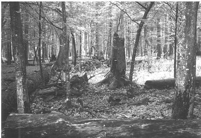
Het strikte oerbosreservaat van Bia³owie¿a; een van nature aftakelend loofbos

stammen door elkaar. In dit muggenrijke reservaat staan Eenzijdig wintergroen en Bosorchissen. Ten zuiden van het reservaat komt het pad eerst nog via een smal bruggetje over het dal van de Narewka. Hier zijn wel sporen van bevervraat te vinden en kunnen IJsvogel en Zwarte ooievaar worden gezien. Ten noorden van "Wysokie bagno" kun je weer over de rode route verder. Volg in bosvak 428C eens het pad naar het oosten, je komt dan op de kruising 428D/454A, waar je naar het noorden kan (Drawny Tryb). Na 2 km kan je niet meer verder en kom je aan de rand van het Nationale Park.