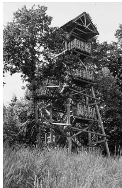
Deze schitterende uitkijktoren aan de rand van het dal van de Narewka kan als een luxueuze en sfeervolle wildkampeerplaats worden gebruikt

Helaas ligt het stuwmeer in de zomer vaak vol met algen. Er zijn dan minder vogels te zien en het kan bovendien stinken! Niets aan te doen en zeker ook jammer omdat dit stuwmeer één van de weinige plekken is waar gezwommen kan worden.