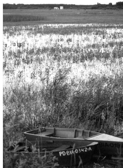
Het stuwmeer van Siemianowka – bijzonder rijk aan vogels

Juist ten noorden van het bos van Białowieża ligt een groots stuwmeer. Het werd in de jaren '80 aangelegd en was voorzien als waterreservoir voor de stad Białystok, dat op zo'n 80 kilometer van het stuwmeer ligt. Het stuwmeer is geen zege voor het bos van Białowieża, omdat het water de grondwaterstanden in het noordelijk deel van het bos beïnvloedt. Ook kent het stuwmeer andere problemen. Ter plaatse van het stuwmeer lag voor de aanleg ervan een ecologisch waardevol deel van het beekdal van de rivier Narew, die hier nog grotendeels op natuurlijke wijze haar weg vond. In het meer zijn de stobben van de Zwarte elzen die vele eeuwen uitgestrekte broekbossen vormden nog zichtbaar. Een ander probleem treedt stroomafwaarts op. Onder meer in het Narew Nationaal Park is geconstateerd dat de visstand sterk negatief beïnvloedt wordt door de sterke algengroei die iedere zomer in het meer optreedt. Tot slot heeft het meer nooit gefunctioneerd voor het doel waarvoor het aangelegd werd.