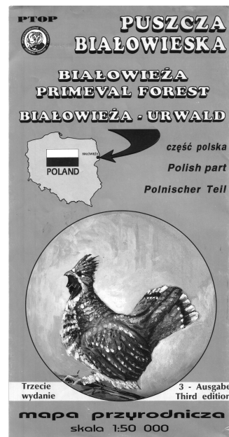
Veelgebruikte topografische kaart van Białowieża (vogelkaart)

Kompas, kaart, bosbouwpadjes en zon – Om niet te verdwalen zijn een kompas en een kaart erg handig, naast uiteraard de zon als oriëntatiemiddel. De groene kaart van PTOP (de vogelkaart) laat veel details van het bos zien. Je kan gemakkelijk bepalen of paden op de kaart in het echt wel begaanbaar zijn. Paden die op de kaart met een doorgetrokken streep zijn aangegeven zijn altijd goed en befietsbaar . Paden met een onderbroken streep zijn vaak redelijk tot goed behoopbaar en soms befietsbaar . De smalle stippelijntjes zijn in het echt meestal slecht of onbegaanbare paden (soms dwars door moerasbos) of passages in het bos die alleen door de verf aan de bomen te volgen zijn (en daardoor onbruikbaar). De voormalige spoorlijn van Hajnowka naar Białowieża is ook goed te belopen en hetzelfde geldt voor een deel van de vroegere smalsporen. Een klein deel van deze smalsporen is echter flink dichtgegroeid. Wandelend kom je er dan wel door, maar met een fiets is dat vrijwel onmogelijk.